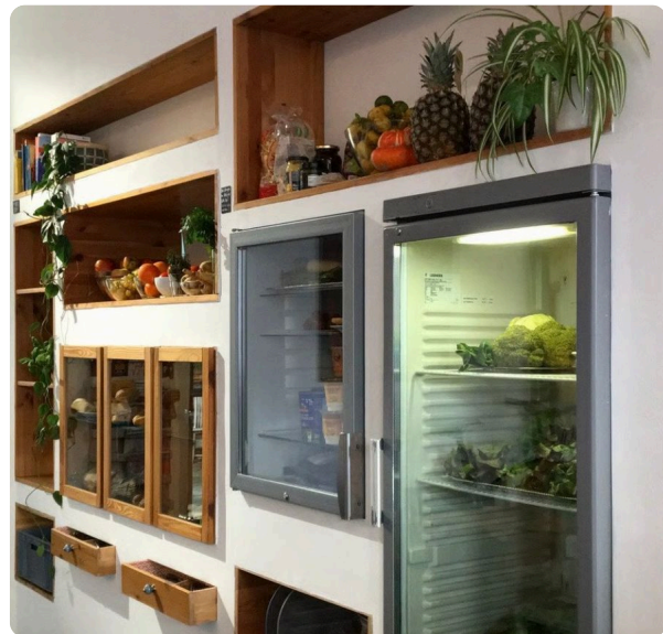
Fairteiler des Café Teilchens